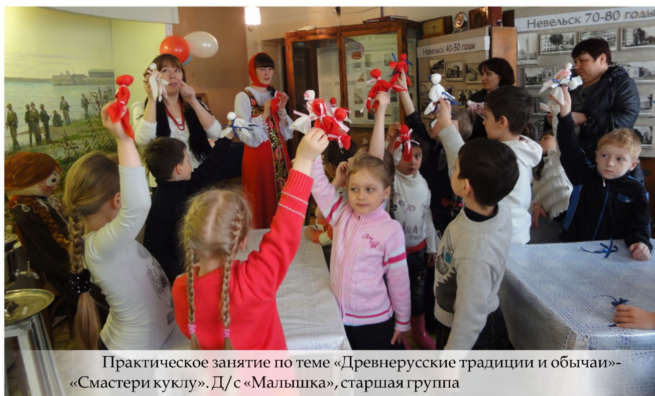
Практическое занятие по теме «Древнерусские традиции и обычаи»- «Смастери куклу». Д/с «Малышка», старшая группа