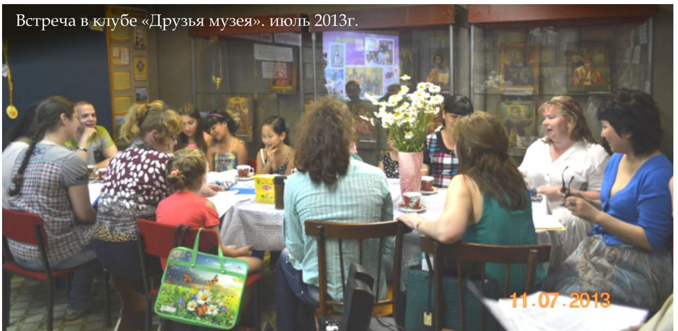
Встреча в клубе «Друзья музея». июль 2013г.

При музее действует разновозрастной клуб «Друзья музея».