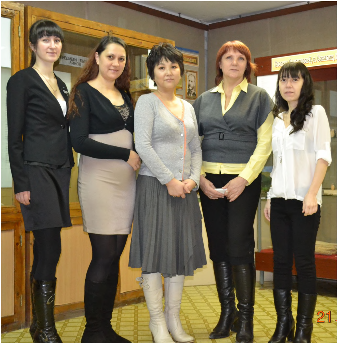
Коллектив музея. 2014 г.