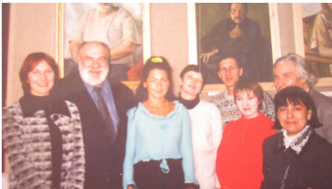
Клуб «У Петра» (рук. П.П. Светличный).