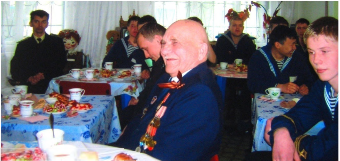
Вечера встреч трех поколений в музее

При музее действует разновозрастной клуб «Друзья музея».